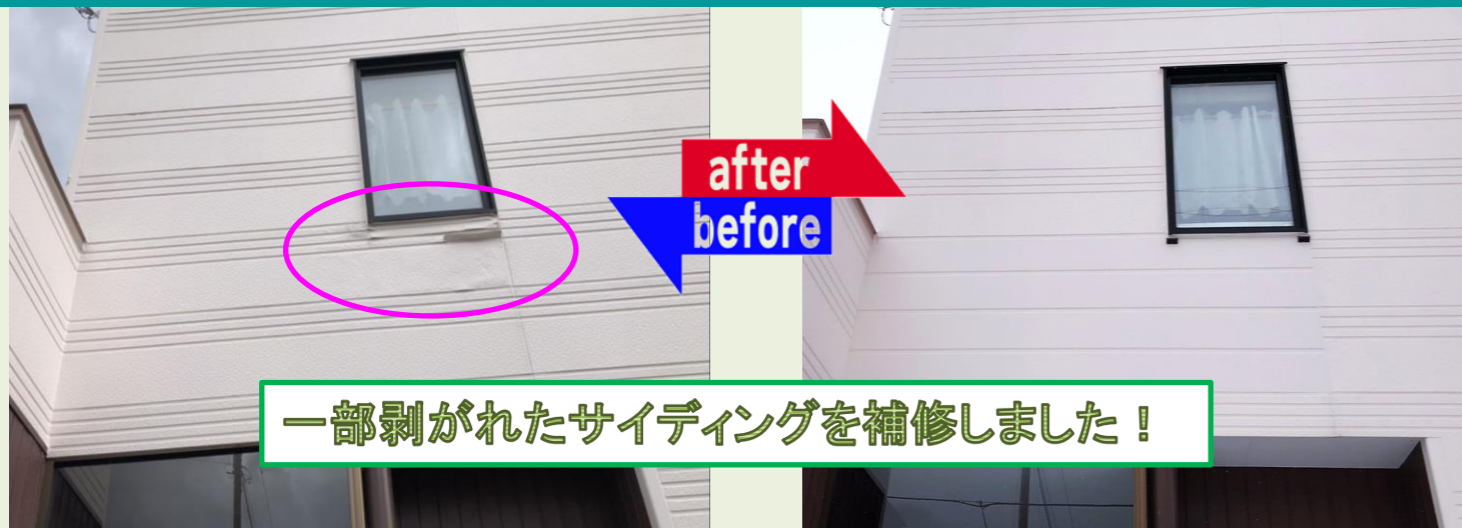
一部剥がれたサイディングを補修しました！